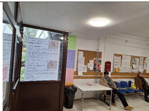
- b -