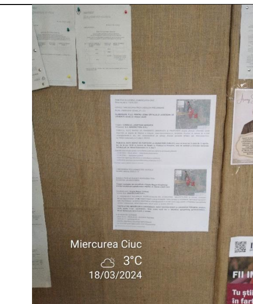
- d -

- în perioada de consultare nu a fost înregistrat nici o adresă privind informații suplimentare d) Dezbaterea publică a avut loc la data de 11 aprilie 2024, joi, ora 16:00, în sala de ședință a Direcției generale Arhitect șef și Gospodărire urbană(D.G.A.S.G.U), strada Mihail Sadoveanu nr. 4, etaj 2 (fostul sediul Postbank).