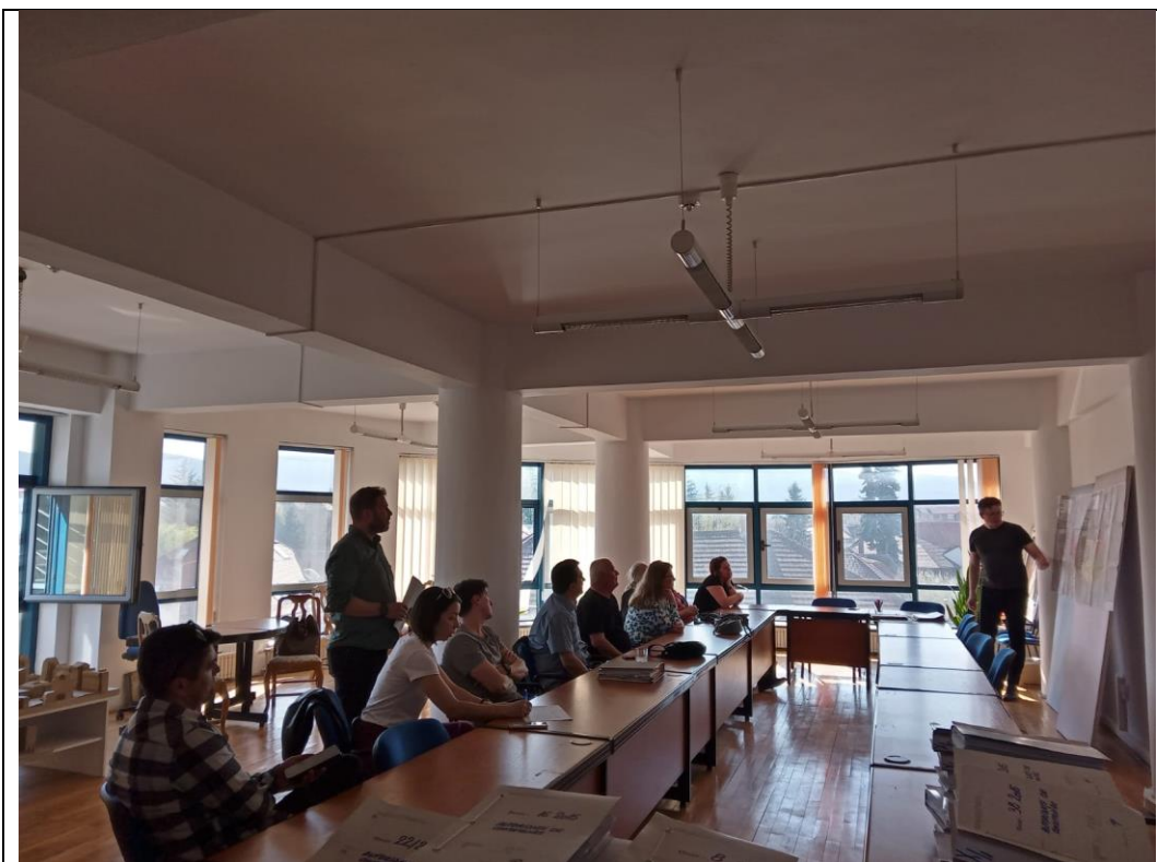
Foto dezbatere publică

A fost prezentată studiul de oportunitate pentru zona studiată.