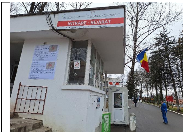
- a -

- Conform Ordin nr. 2701 din 2010, inițiatorul planului urbanistic zonal a afișat anunțul pentru dezbaterea publică pe panouri rezistente la intemperii, în loc vizibil la parcela care a generat planul urbanistic zonal. Au fost afișate patru panouri în limba maghiară și în limba română – a,b - c - și corpul principal al Primăriei Municipiului Miercurea-Ciuc, în parter în incinta intrării principale - d -.